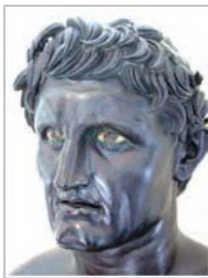
سردیس مؤسس حکومت سلوکیان