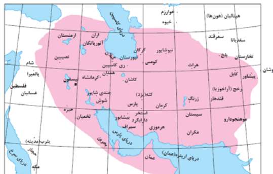
نقشه‌ی قلمرو ساسانیان