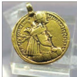
سکه‌ی بلاش - پادشاه اشکانی