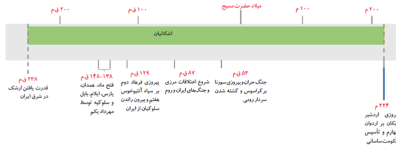
نمودار خط زمان حکومت اشکانی