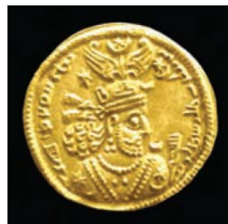
سکه‌ی خسرو انوشیروان