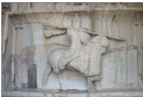
نقش برجسته‌ی خسرو پرویز - طاق بستان، کرمانشاه

پسر و جانشین هرمز بود که به بی‌زانس گریخت و با حمایت امپراتور روم، بر تخت سلطنت نشست.