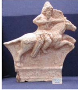
سنگ‌نگاره سواره نظام اشکانی