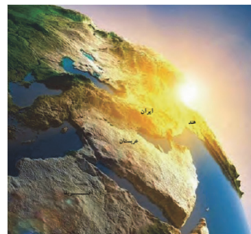
زمین از غرب به شرق می‌چرخد.

از آن جایی که زمین از غرب به شرق می‌چرخد، در بین سه کشور مطرح‌شده، ابتدا هند، سپس ایران و در نهایت عربستان طلوع خورشید را مشاهده می‌کنند.