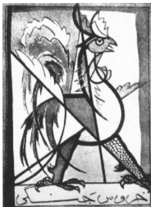
نشان انجمن خروس جنگی