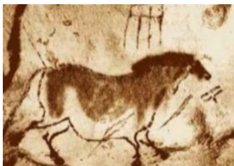
نقاشی‌های دیواری غار دوشه در لرستان، حدود ۸۰۰۰ سال پیش از میلاد