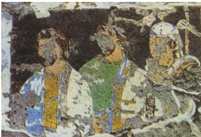
نقاشی دیواری کوه خواجه در سیستان، سده‌ی اول میلادی