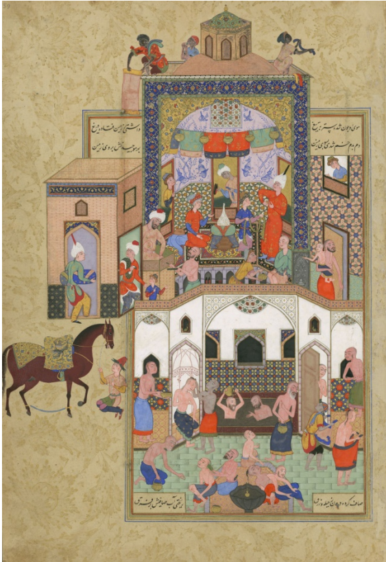
هفت‌اورنگ جامی - مکتب مشهد