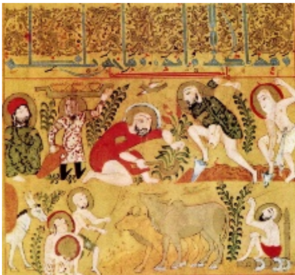
برگی از کتاب ورقه و گلشاه مربوط به سده‌ی پنجم ه.ق.