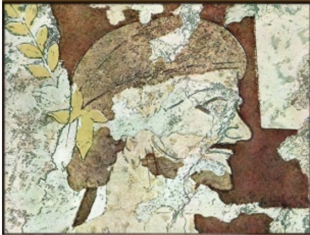
نقاشی دیواری کوه خواجه در سیستان، سده‌ی اول میلادی